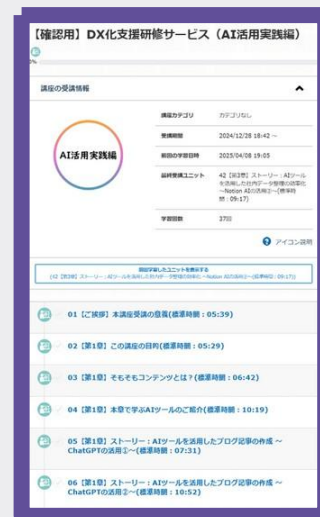
プラットフォームイメージ